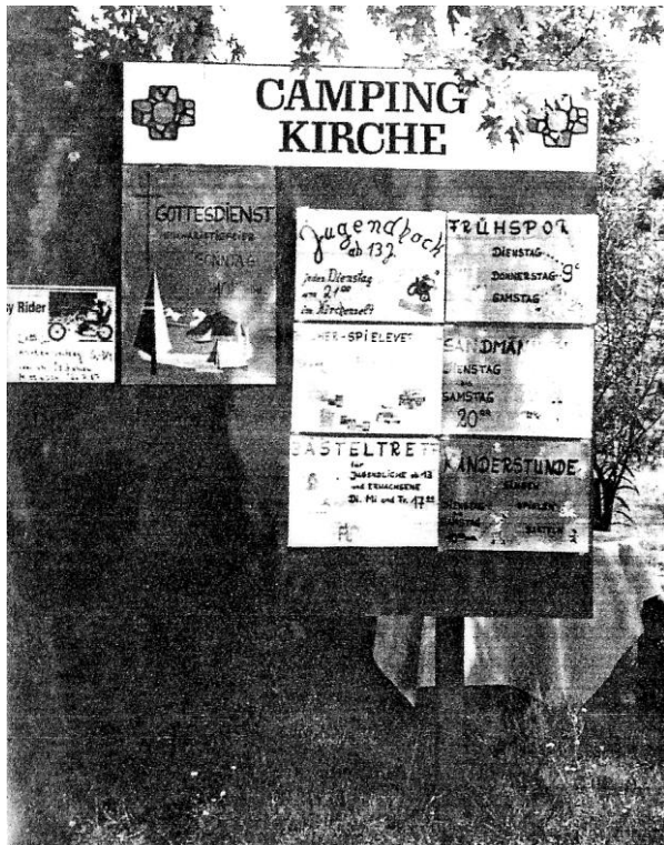
Vom Abendgebet bis zum Frühsport reichen die vielfältigen Kirchen-Angebote auf dem Stollhofener Campingplatz. Besonders um die Kinder müht sich das Team. Gefällt es denen, finden auch Eltern den Weg.